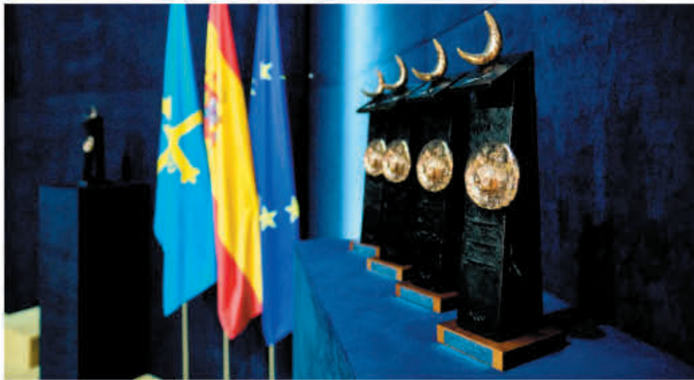
Este premio reconoce la labor de OEI y su rol de enlaces entre Europa e Iberoamérica.

El Premio Princesa de Asturias será entregado formalmente a OEI en el mes de octubre, en una ceremonia solemne