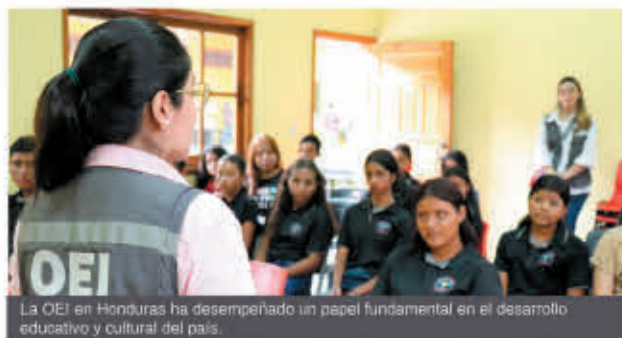
La OEI en Honduras ha desempeñado un papel fundamental en el desarrollo educativo y cultural del país.

Entre las iniciativas más destacadas de la OEI en Honduras, se incluyen la alfabetización, la mejora de la calidad educativa y el fortalecimiento de capacidades en educación artística, entre otros