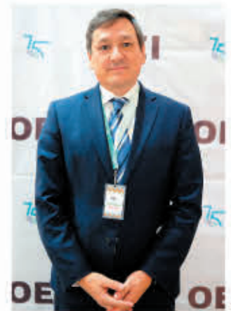
Andrés Guillermo Delich Secretario General Adjunto de la OEI

que llevó luz a escuelas rurales mediante la instalación de paneles solares. También destaca la respuesta rápida de la organización durante la pandemia, produciendo contenidos digitales para las escuelas y capacitando a más de 100,000 maestros.