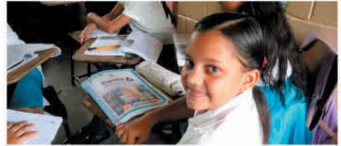
OEI apoya acciones sociales educativas integrales para la atención de las niñas y niños en los primeros años del desarrollo.

El campo de acción de OEI abarca proyectos educativos desde el nivel infantil hasta el nivel superior