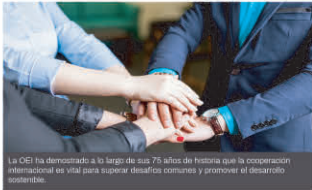
La OEI ha demostrado a lo largo de sus 75 años de historia que la cooperación internacional es vital para superar desafíos comunes y promover el desarrollo sostenible.

El diálogo y las alianzas estables con las diferentes instituciones y organizaciones de la región se encuentran en el corazón de la OEI desde su fundación